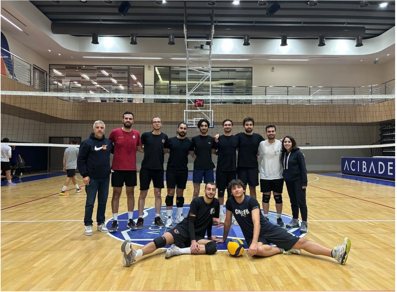
GTU İAPS Sawtech